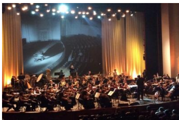
«Армен-фильм» Non-Stop Проект Государственного молодёжного оркестра Республики Армения