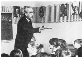
Международная научно-практическая конференция «Кабалевский-композитор, учёный, педагог»