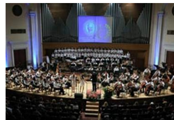
К 75-летию Ереванской средней специальной музыкальной школы имени П.И. Чайковского