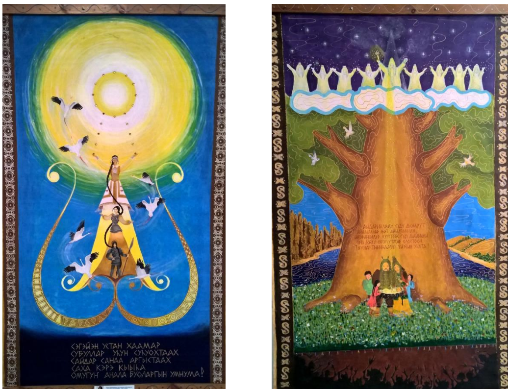
Рис.3-4. Мифологические сюжеты в современных художественных работах.

Образное восприятие мира, отраженное в наскальных рисунках древних, удивительным образом сохранилось в мышлении многих наших современников, живущих в этом регионе сегодня. Мы знаем, что в искусстве определяющую роль играет художественный образ. Именно художественный образ является главной целью и смыслом любого искусства . Для понимания содержания, воплощенного в произведении и умения создать художественный образ в собственной деятельности, важно сохранить, свойственное всем детям мифологическое мышление, которое, не находя поддержки в процессе становления человека, с возрастом пропадает. Ю.М. Лотман писал о том, что мифологический мир ...сознания ...способен «функционировать как генератор ассоциаций и один из активных моделирующих механизмов» . В современном мире способность к моделированию действий, ситуаций, предметов особенно актуальна. Это определяет особую значимость в образовании проблемы создания педагогических условий сохранения у подрастающего человека элементов мифологического сознания, свойственных каждому ребенку. Это под силу только искусству. Именно оно может избавить ребенка в будущем от того, чтобы взаимодействие знаковых систем с различными языками не вызывало для него трудностей в понимании информации.